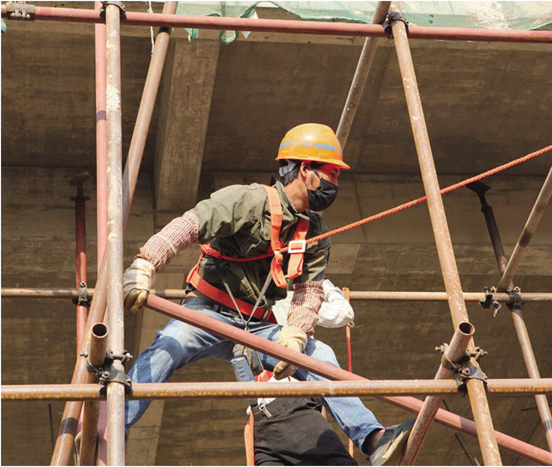
进入3月，电力公司农网改造升级在建项目陆续复工，各项工地又逐渐恢复了往日的施工景象。电力公司加大了现场督导工作力度，施工单位根据具体作业项目，有针对性地采取三班倒的方式加紧施工，尽最大努力追回疫情影响的工程进度。（李云生）